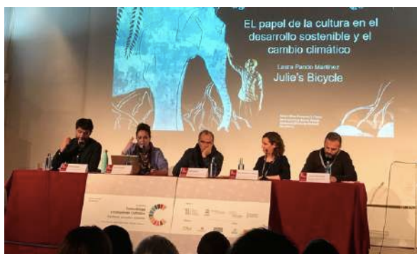
Mesa redonda 'Liderazgo y apropiación del discurso sobre desarrollo sostenible en las instituciones culturales