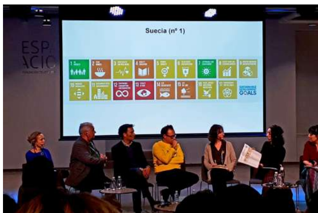
Debate Cultura y Sostenibilidad, Fundación Telefónica Madrid (oct. 2018)