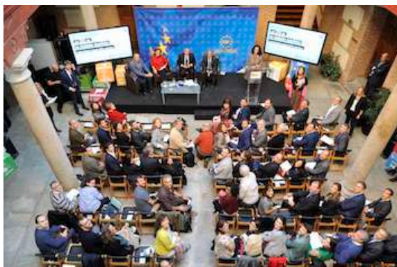
Vista general de la sede FEMP