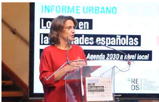
Intervención de Teresa Ribera, ministra para la Transición Ecológica