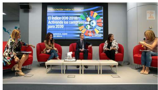
Mesa redonda sobre los avances de la implementación de la Agenda 2030 en España