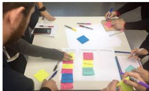
Taller sobre práctica cultural sostenible

Hashtags del evento: #CulturaSostenible #IICulturaODS