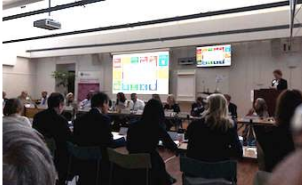
Reunión SDSN Leadership Meeting (Estocolmo, mayo 2018)