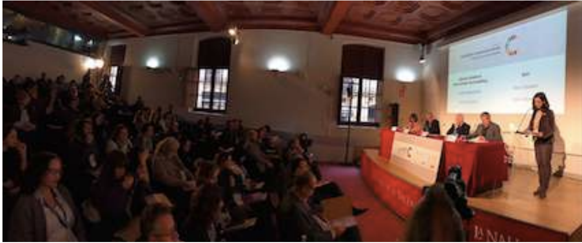
Bienvenida a las jornadas. Vista del auditorio