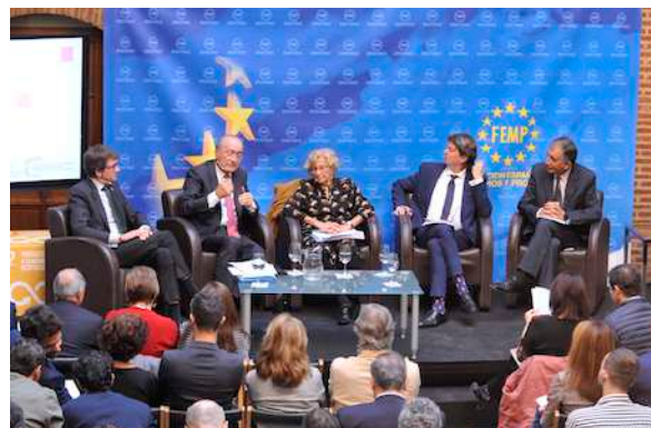
Mesa de debate con alcaldes