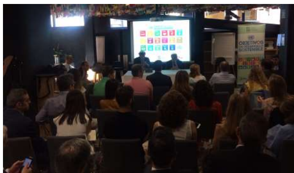
Desayunos ODS con... Miguel A. Moratinos