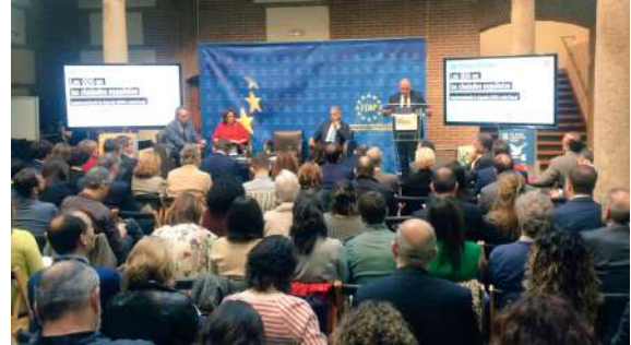
Inauguración de la jornada a cargo del secretario general de la FEMP